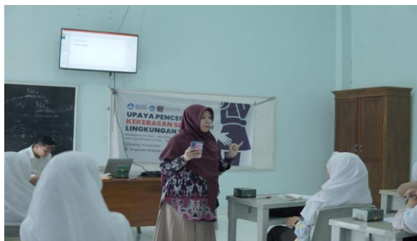
Gambar 1. Sesi Penyampaian materi

Kegiatan dimulai dengan sesi perkenalan antara Tim PkM dan siswa. Tim mencoba untuk berdialog santai baru kemudian memberikan materi penyuluhan. Pada materi penyuluhan disampaikan beberapa isu penting seperti kerentanan Perempuan dan sekolah terhadap isu pelecehan seksual, modus dan bentuk bentuk pelecehan, hingga memberikan tips untuk mencegah maupun upaya pemecahan masalah jika mengalami pelecehan.